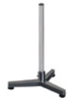
Columna en acero pintado