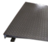
Rampa de acceso