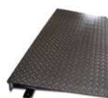
Rampa de acceso (h=110 mm)